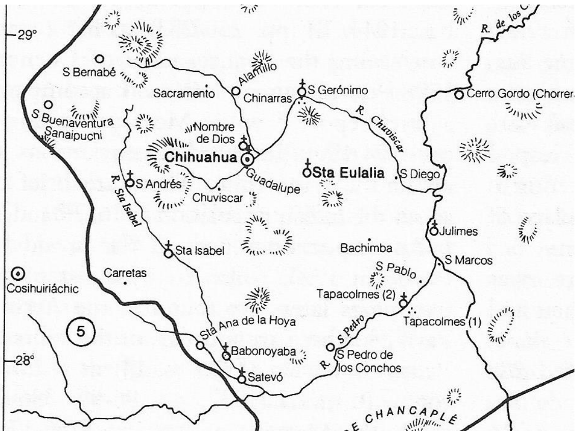
Map of San Geronimo and its proximity to the Villa de Chihuahua, Nueva Vizcaya (The North Frontier of New Spain, Peter Gerhard, page 196)

This census is a household-by-household type in tabular format. Portions of the original census are damaged and difficult to read. The households are numbered, the persons are grouped by categories of sex, age (assumption is age 14 and above and under the age of 14), widowers, widows, unmarried (male and female) and servants ( criados ). If the person is married, the name of his spouse immediately follow his entry. If the person is widow, then they are designated as such, e.g. Viudo, Viuda . The person's racial designation follows their name, if head of household, and their children are assumed as the same unless otherwise designated. There are no occupations recorded and no record of where the residents originated from, i.e. were they natives of the area, elsewhere in Nueva Vizcaya, or beyond Nueva Vizcaya.