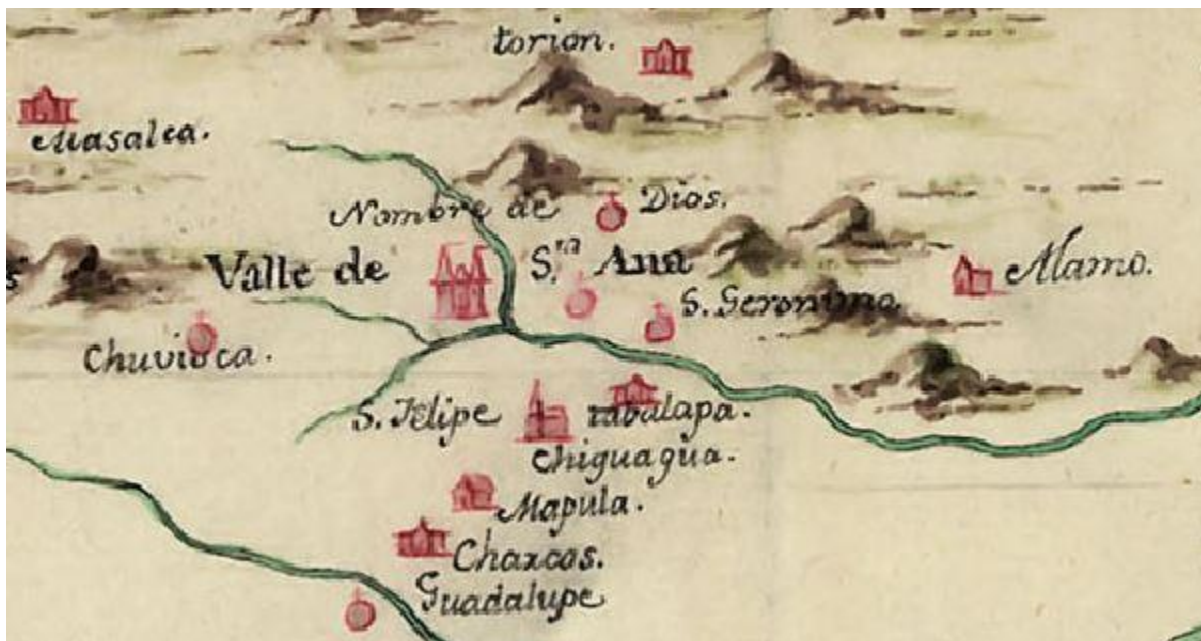
Close up of San Geronimo area and its proximity to the Villa de Chihuahua (Chiguagua)

This transcription of the 1785 census for San Geronimo and including Tabalopa, Santa Ana and Nueva Colonia de Yndios, Nueva Vizcaya is intended to serve as a companion guide to the original census record (obtained from the University of Texas at El Paso library, microfilm number 502, roll 3). Since the original census record is the primary record, it should always be consulted for final determination of information.